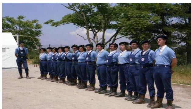
ESERCITAZIONE DI PROTEZIONE CIVILE "EMERVOL SUD 1986"

naturale quali terremoti e eruzioni sia livello locale che nazionale. Queste stesse attività che, attraverso un percorso fatto di impegno e professionalità, hanno permesso alla C.R.I. di raggiungere gli standard di qualità ed affidabilità che oggi contraddistinguono l'associazione.